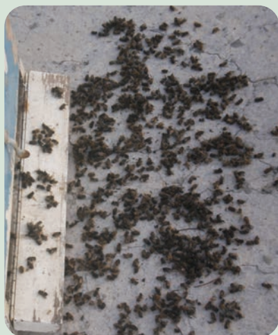
Δηλητηριασμένες μέλισσες μπροστά από κυψέλη

Αξίζει να σημειωθεί ότι στο 80% των εντομοφίλων φυτών, η γονιμοποίηση συντελείται με τη βοήθεια των μελισσών. Το 80%-90% της παραγωγής πολλών καρποφόρων δέντρων ή φυτών μεγάλης καλλιέργειας οφείλεται στη συμβολή του παράγοντα μέλισσα. Επιπλέον, τα προϊόντα που παίρνει ο μελισσοκόμος από τις μέλισσες αντιπροσωπεύουν μόνο το 1-10% της προσφοράς τους, ενώ το 90-99% το προσφέρουν στη γεωργία. Ένα μέτριας δυναμικότητας μελισσι υπολογίζεται ότι έχει έως και 40 φορές περισσότερη αξία για την επικονίαση που επιτελεί παρά για την