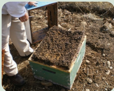
Ολοκληρωτική θανάτωση διώροφου μελισσιού από φυτοφάρμακο

Η χρήση εντομοκτόνων σε καλλιέργειες ή οπωρώνες, κατά τη διάρκεια της περιόδου άνθισης, έχει ως αποτέλεσμα την παρουσία φαρμάκου στα άνθη και όταν οι συλλέκτριες επισκέπτονται τα φυτά αυτά να λαμβάνουν τη δηλητηριασμένη τροφή (νέκταρ ή γύρη). Όταν το δηλητήριο έχει οξεία δράση, τότε οι μέλισσες πεθαίνουν επί τόπου, ακόμη και μέσα στα άνθη ή πριν προλάβουν να επιστρέψουν στην κυψέλη. Όταν η δράση του δηλητηρίου είναι βραδεία τότε οι μέλισσες είτε επιστρέφουν στην κυψέλη, όπου και πεθαίνουν, είτε πεθαίνουν κοντά στην κυψέλη. Τονίζεται ότι οι συλλέκτριες μέλισσες που μεταφέρουν μοιυσμένη τροφή, παρεμποδίζονται από τις μέλισσες-φρουρούς να μπου στην κυψέλη ή απομακρύνονται χωρίς να αφήσουν το φορτίο τους. Εάν, όμως, δεν γίνει γρήγορα αντιληπτό από τις μέλισσες ότι εισέρχεται τοξική τροφή και νερό στη φωλιά τους, τότε είναι ιδιαίτερα καταστροφικό στην περίπτωση που η γύρη αυτή